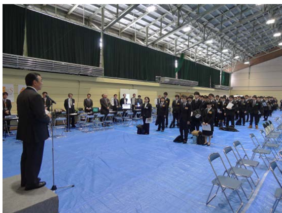
全体説明会の様子

セミナー会場では、参加した学生らが企業担当者の話に熱心に耳を傾ける姿が見受けられました。これを機に企業とのマッチングが成立し、オホーツク地域の活性化に繋がることを期待しています。