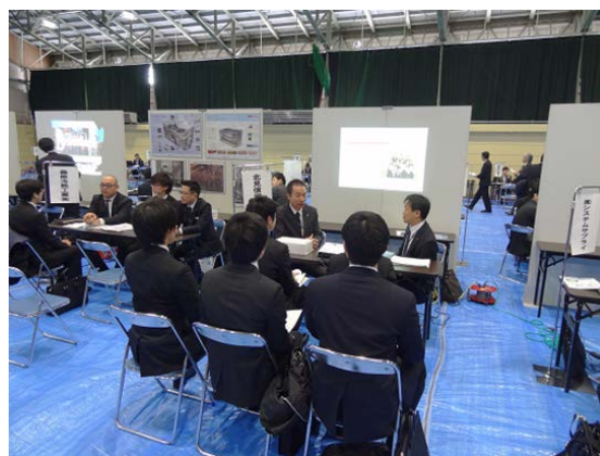
各企業ブースでの様子