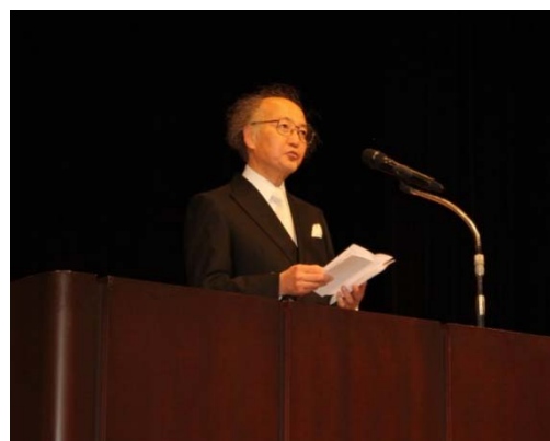
学位記授与式の様子