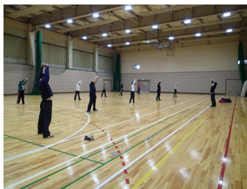
前崎氏に合わせて体を動かす参加者