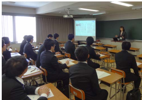
個別セミナーの様子