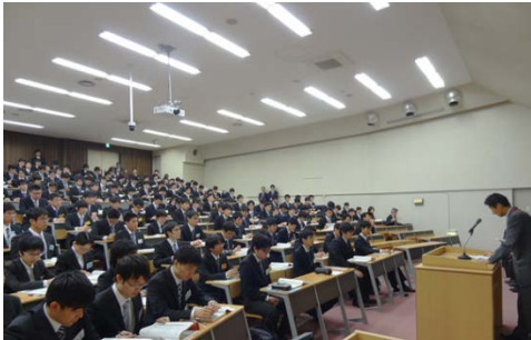
全体説明会の様子

連日の開催の中、学生には多少の疲れも見られましたが、企業との出逢いを求め積極的に担当者の話を聞いている姿が見受けられました。学生の皆さんの就職活動が実りあるものとなるよう、次年度に向けてもさらに時期や規模などを検討していく予定です。