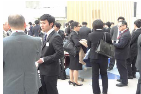
情報交換会の様子