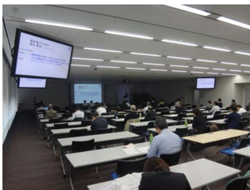
新技術説明会会場

ェースを使ったネット仮想空間の操作技術」と題して研究の成果を説明しました。プレゼンテーションの後には研究の成果に興味を持つ企業の方々と各先生方との個別相談が行われ、さらに深い技術や共同研究の可能性等について話し合いが行われました。新技術説明会は、発表者の研究力向上に繋がる貴重なネットワーク形成の機会であり、また今後の研究・産学官連携の発展に向けた有意義な広報・情報交換の機会でもあります。今後も積極的な参加・発表を継続していきたいと考えています。